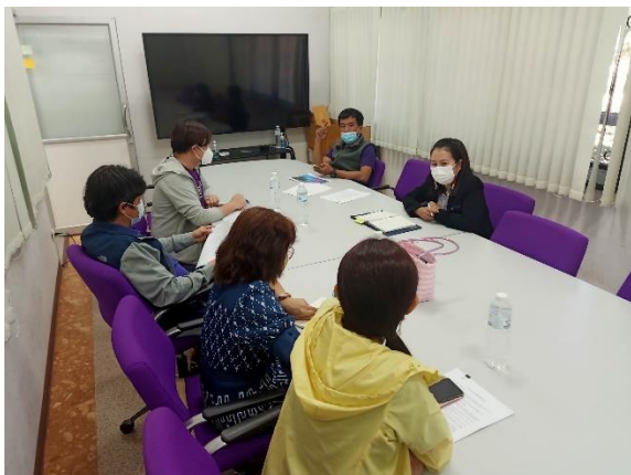
กองบริการการศึกษา