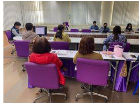
คณะสหเวชศาสตร์