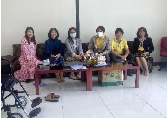
สภาพนักงานมหาวิทยาลัยพะเยา