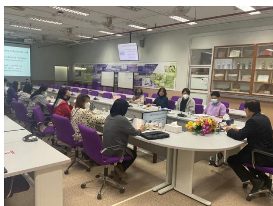
คณะวิทยาศาสตร์