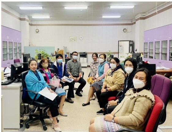
หน่วยตรวจสอบภายใน

ผู้เข้าร่วมโครงการ มีแนวทางในการดำเนินงานด้านพัสดุให้เป็นไปด้วยความถูกต้องตามพระราชบัญญัติจัดซื้อจัดจ้างและบริหารงานพัสดุ เกิดความคุ้มค่า โปร่งใส มีประสิทธิภาพและประสิทธิผล พร้อมทั้งลดข้อผิดพลาดในการปฏิบัติงาน และสามารถนำมาเป็นแนวทางในการปรับปรุงและพัฒนาการทำงานต่อไป