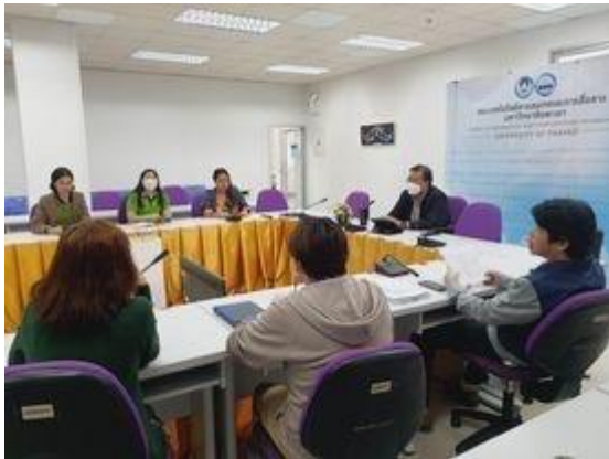
คณะเทคโนโลยีสารสนเทศและการสื่อสาร