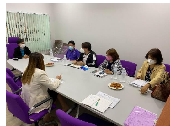
สำนักงานสภามหาวิทยาลัยพะเยา