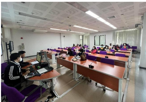
คณะทันตแพทยศาสตร์